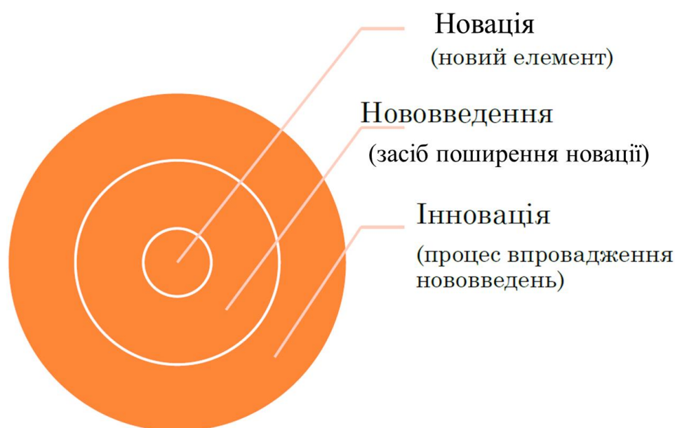
Рис. 1. Розмежування понять «новація», «нововведення» та «інновація»

На нашу думку, ці категорії мають змістові відмінності щодо результату, який планується досягти, створюючи нововведення або інновацію – від приналежності декільком етапам інноваційного процесу й можливого не впровадження до присутності у повному циклі практичного впровадження, відповідно.