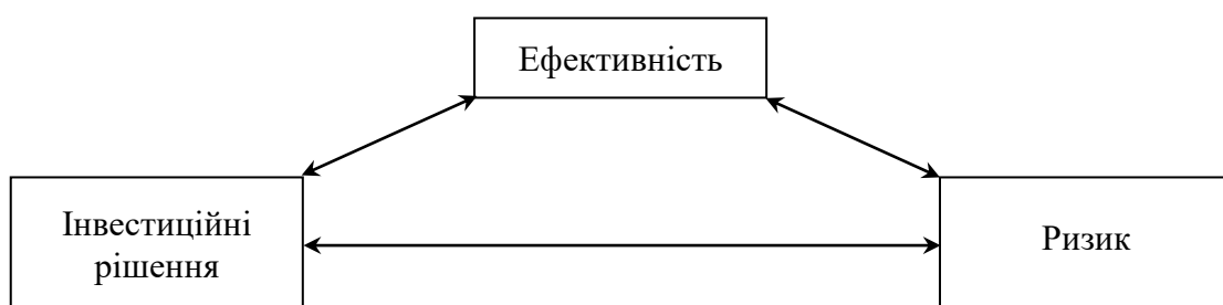
Рис. 3.2. Модель взаємозв'язку ефективності, інвестиційних рішень і ризику

Отже, ефективність, ризик і прийняття інвестиційних рішень взаємозалежні (рис. 3.2).