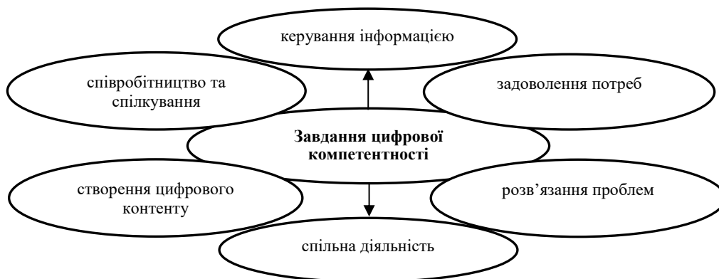
Рис. 2. Завдання цифрової компетентності [17]

А. Феррарі цифрову компетентність трактує як «набір знань, умінь, які необхідні для використання інформаційних технологій та цифрових медіа для виконання завдань, розв'язання проблем, керування інформацією, співробітництва та спілкування, створення і поширення контенту, спільної діяльності та задоволення потреб» [17] (рис. 2).