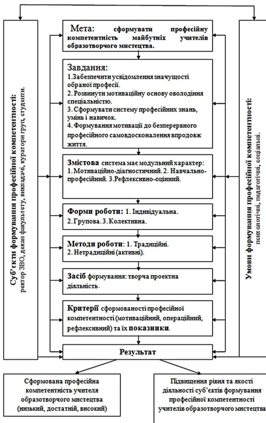
Рис. 1. Модель формування професійної компетентності майбутніх учителів образотворчого мистецтва засобами творчої проектної діяльності

З метою успішного та повного формування професійної компетентності майбутніх учителів образотворчого мистецтва ми орієнтувалися на внутрішню мотивацію особистості, лишаючи певне місце (мінімальний відсоток) на зовнішні фактори, які, крім внутрішньої та зовнішньої, розділили на три рівні, що відображено у розробленій нами схемі (рис. 2).