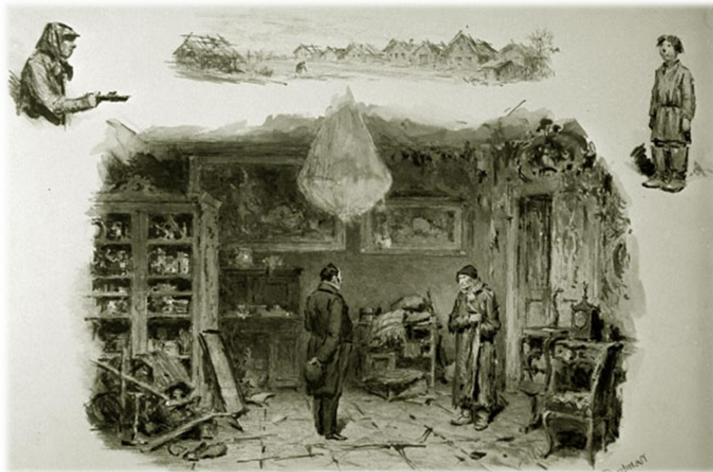
Ілюстрація Петра Соколова до поеми Миколи Гоголя Мертві душі. Чичиков у Плюшкіна

Сюжет "Мертвих душ" – це історія кмітливого чиновника-пройдисвіта Чичикова, який вирішив збагатитись на купівлі "мертвих душ", тобто реєстрів померлих селян, які фіктивно, за паперами, можуть бути видані за живих і в такий спосіб примножити статки поміщика додатковою кількістю приписаних йому кріпосних душ. У процесі роботи авторський задум поеми значно розширився. Гоголь приходить до думки про необхідність створення трьох томів. Проте цей великий задум не був завершений.