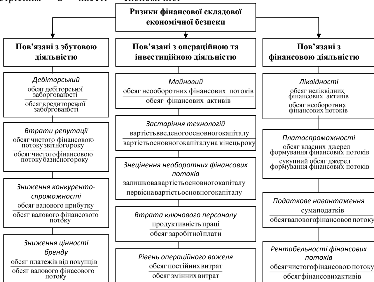
Рис. 2. Методика оцінки ризиків підприємницької діяльності

категорії та зайняло провідне місце в сучасних економічних дослідженнях як на державному, регіональному рівнях, так і на рівні підприємств агропродовольчої галузі [4].