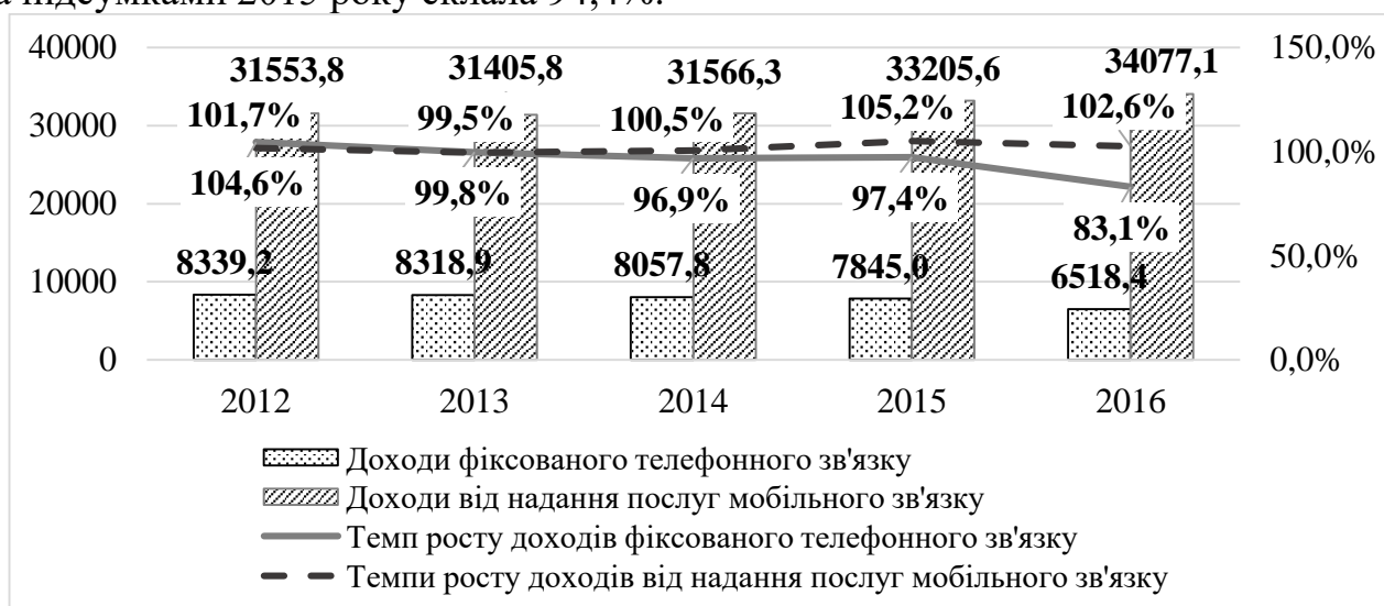
Рис. 2. Динаміка доходів мобільного та фіксованого телефонного зв'язку за 2012-2016 рр., млн грн*

У 2016 році доходи від надання послуг мобільного зв'язку зросли на 2,6% у порівнянні з 2015 роком і склали 34077,1 млн грн, що становить у загальному обсязі доходів сфери телекомунікацій 55,0% (рис. 2).