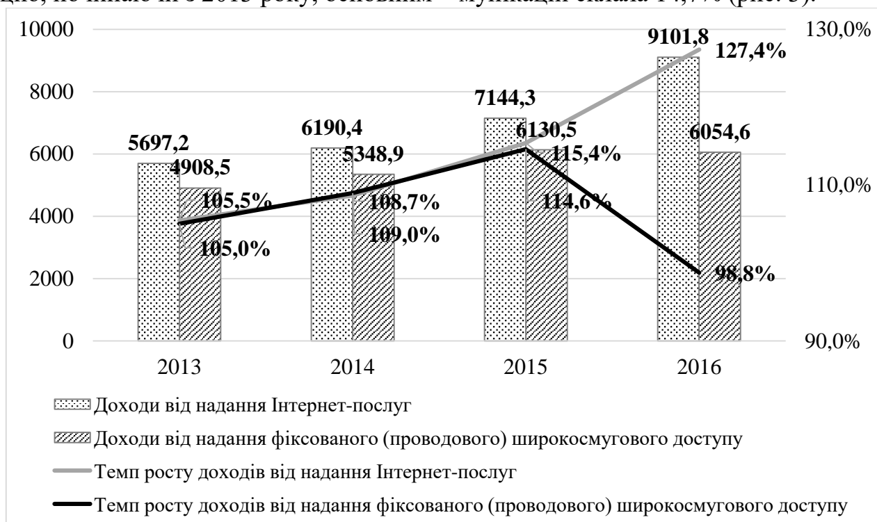
Рис. 3. Динаміка доходів від надання послуг доступу до мережі Інтернет та ШСД у 2013-2016 рр., млн грн*

Обсяги доходів від надання послуг фіксованого (проводового) широкосмугового доступу (ШСД) до мережі Інтернет у 2016 році в порівнянні з аналогічним періодом минулого року збільшились на 1957,5 млн грн і становлять 9101,8 млн грн, їх питома вага в загальному обсязі доходів сфери телекомунікацій склала 14,7% (рис. 3).